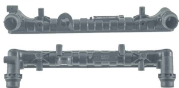
730 / Fox / Golf / Polo / Audi