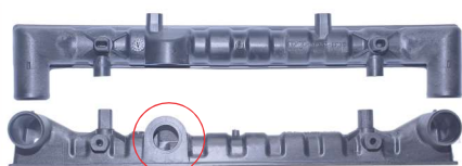
762 / Gol G5 Similar Visconde Superior Aberto