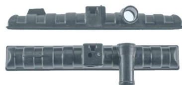
770 / Gol 87 Inferior