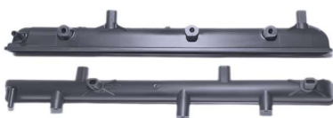
768 / Gol G5 Similar Denso Inferior