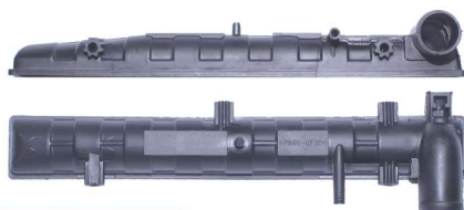
760 / Gol G3 Superior