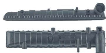
790 / Gol Bola Canelado C/ Ar Superior Turbo