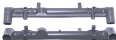
769 / Gol G5 Similar Denso Superior