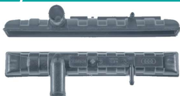
780 / Gol 87 Superior