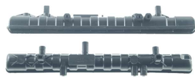
767 / Golf / Cross Fox Space Fox Inferior