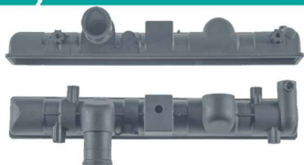
750 / Gol G3 Inferior S/ Cano