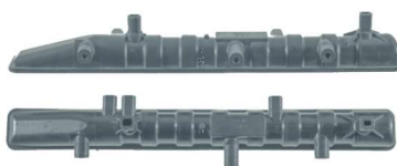
731 / Fox / Golf / Polo / Audi Inferior