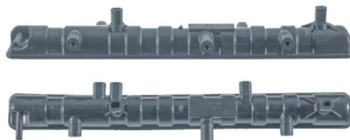
766 / Gol G5 Inferior Lado Retorno