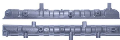
763 / Gol G5 Similar Visconde Inferior