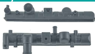
740 / Gol G3 Inferior C/ Cano