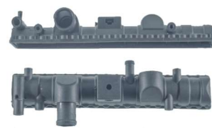
791 / Gol Bola Canelado C/ Ar Inferior Turbo C/ Cano