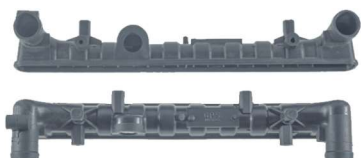
765 / Gol G5 Superior Lado Mangueira Cebolão Aberto